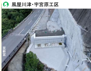
1号橋A1橋台工事完了 (R3.8)

県事業：新天辻工区 (7.2km) 阪本工区 (1.4km) 直轄権限代行：長殿道路 (2.7km) 風屋川津・宇宮原工区 (6.9km) 十津川道路(Ⅱ期) (5.6km)