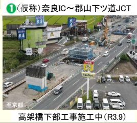
高架橋下部工事施工中 (R3.9)

<用地取得状況> H29.3月末 残件数 263件 (取得率 35%) R2.3月末 残件数 118件 (取得率 71%) R3.9月末 残件数 68件 (取得率 84%)