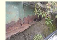
<主桁腐食> 国道165号(吸原橋)