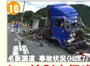
名阪国道 事故状況(H29.7)