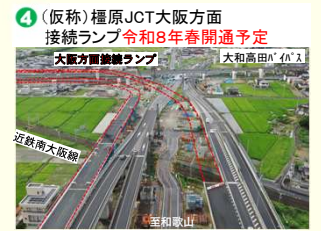
4 (仮称)橿原JCT大阪方面 接続ランプ 令和8年春開通予定 大坂方面連絡ランプ