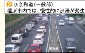
2 京奈和道(一般部) 橿原市内では、慢性的に渋滞が発生

<用地取得状況> H29.3月末 残件数 104件 (取得率 75%) R2.3月末 残件数 13件 (取得率 97%) R3.9月末 残件数 1件 (取得率 99%)